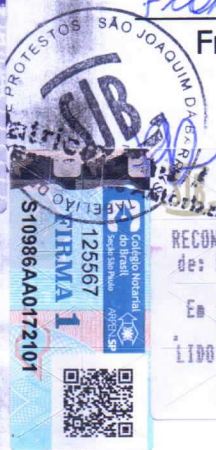
Tabela de Notas e Protesto São Joaquim da Barra - SP